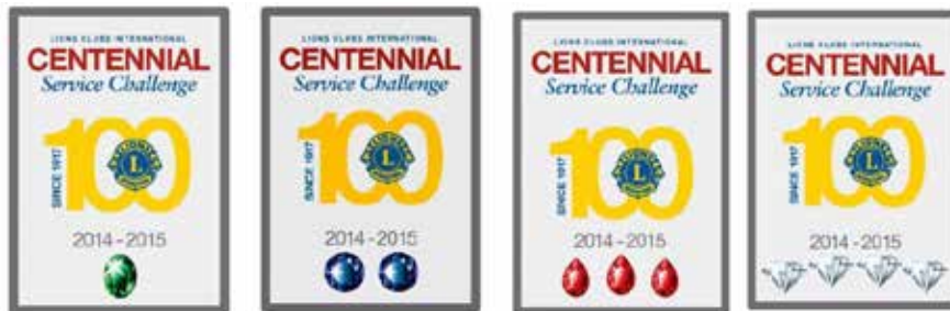
キャンペーン 1 つ キャンペーン 2 つ キャンペーン 3 つ キャンペーン 4 つ

クラブの CSC アワードはどのようなものですか？ アワードのデザインは、報告された CSC キャンペーンの数によって決まります。宝石の上に刺繍される年度は、CSC の進行とともに変わっていきます。